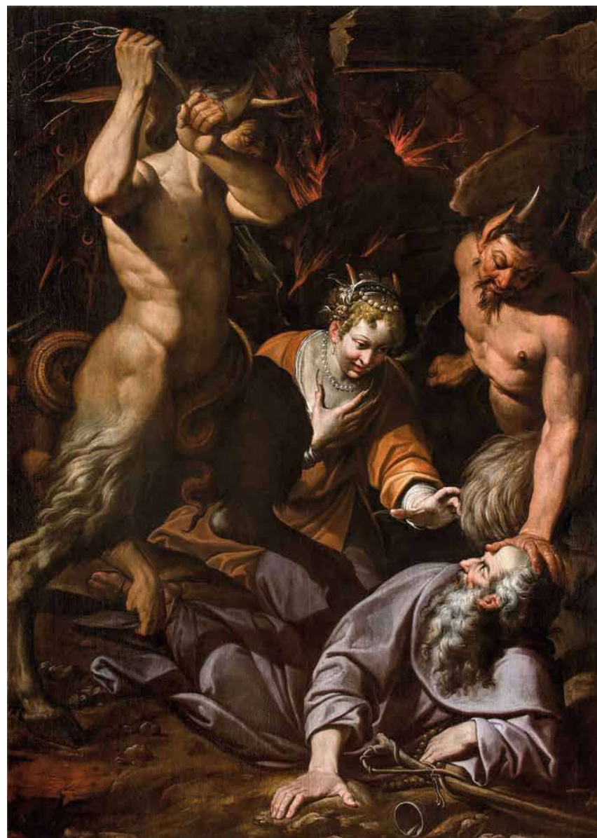
Camillo Procaccini, Le tentazioni di sant'Antonio Abate , (Parma, 1561- Milano, 1629) olio su tela, 255 x 190 cm

Via Centolance, 18 - Noceto (PR) Tel. 0521 625181 - 39336570765