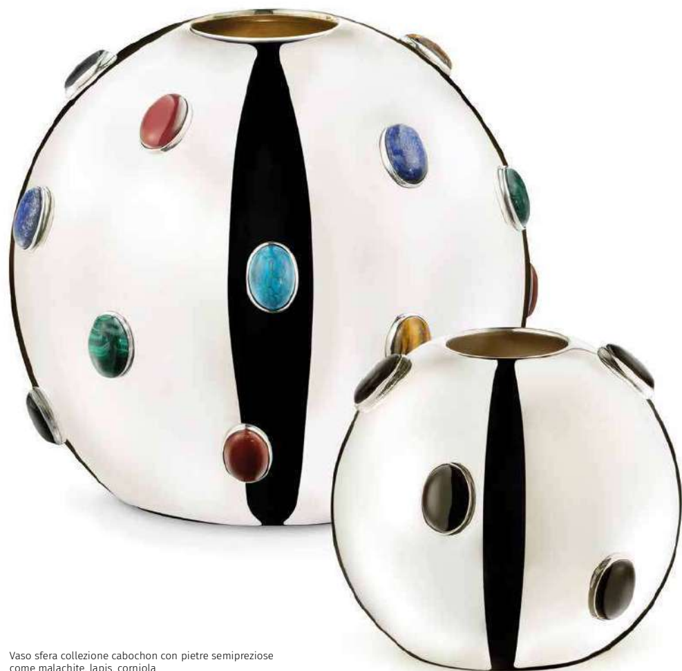
Vaso sfera collezione cabochon con pietre semipreziose come malachite, lapis, corniola