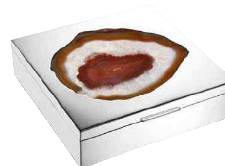
Scatole in argento realizzate a mano con amoniti o pietre dure incastonate nel coperchio