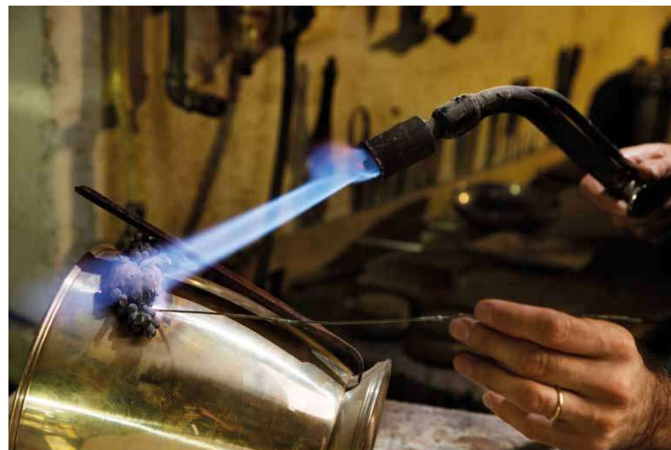
Saldatura di elementi realizzati in fusione su secchio champagne