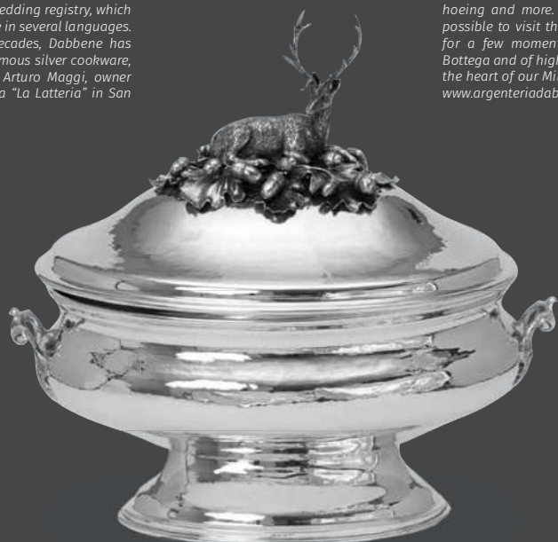
Zuppiera in argento. Collezione animali del bosco con cervo, ghiande e foglie