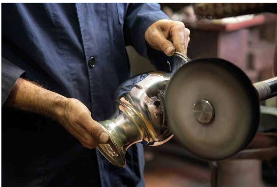
Passaggio di lucidatura di un oggetto in argento

Sambonet, Broggi e molti altri ancora tra cui la collaborazione commerciale con A&B living per completare l'ambito interior design and decoration.