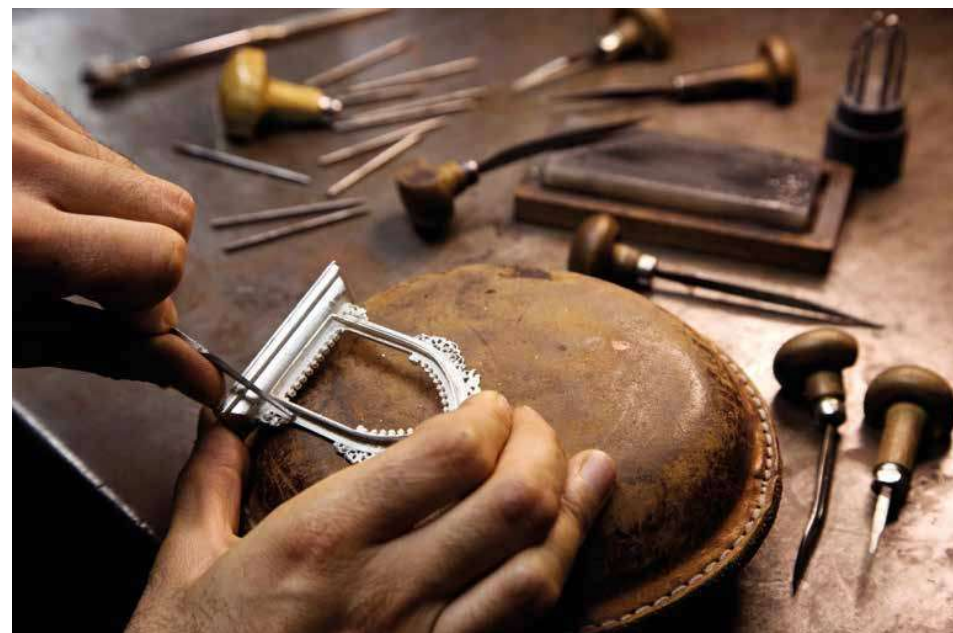
Passaggio di rifinitura a mano di cornice per madonnina.