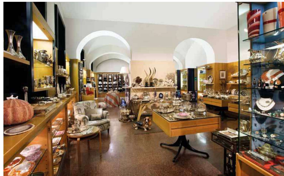
Interno negozio, sala interna