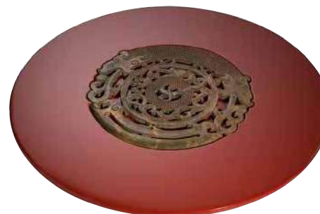
Centrotavola girevole in legno laccato con piastra in giada cotta

L'estro di Dabbene non solo si manifesta per i pezzi esclusivi ma anche per divertenti monili quali i portachivi e corni